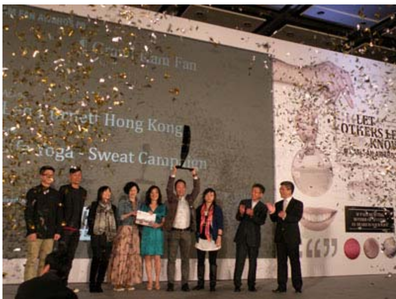
最激动人心的一刻